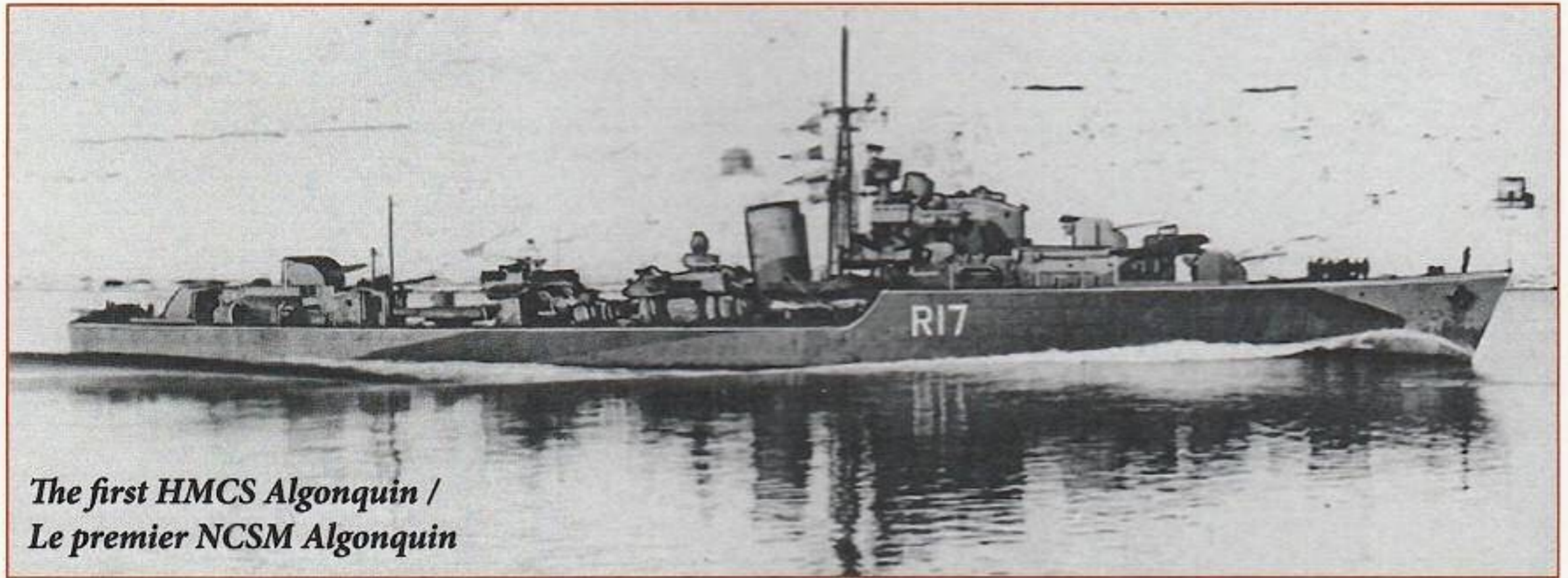
The first HMCS Algonquin / Le premier NCSM Algonquin

Placée en tête de mât, la flamme de mise en service est hissée le jour de la mise en service du navire, et on ne l'enlève que pour la remplacer par le drapeau personnel du souverain ou d'un officier supérieur lorsque ce dernier est à bord. L'origine de l'expression « en service » remonte au temps de la marine à voile et fait référence au capitaine recevant un brevet pour mettre un des navires de Sa Majesté en service. L'officier nommé capitaine d'un navire désarmé employait habituellement un bateau à rames pour se faire amener au navire. Il réunissait ensuite les membres de son équipage, hissait sa flamme et le bon pavillon, et lisait à haute voix son brevet. À partir de ce moment, on disait que le navire était « en service ».