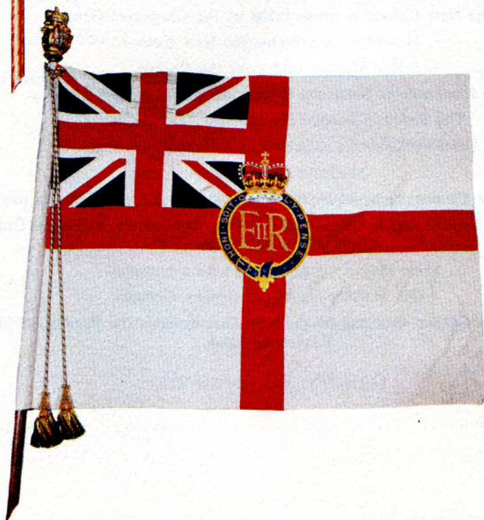
The Old Colour