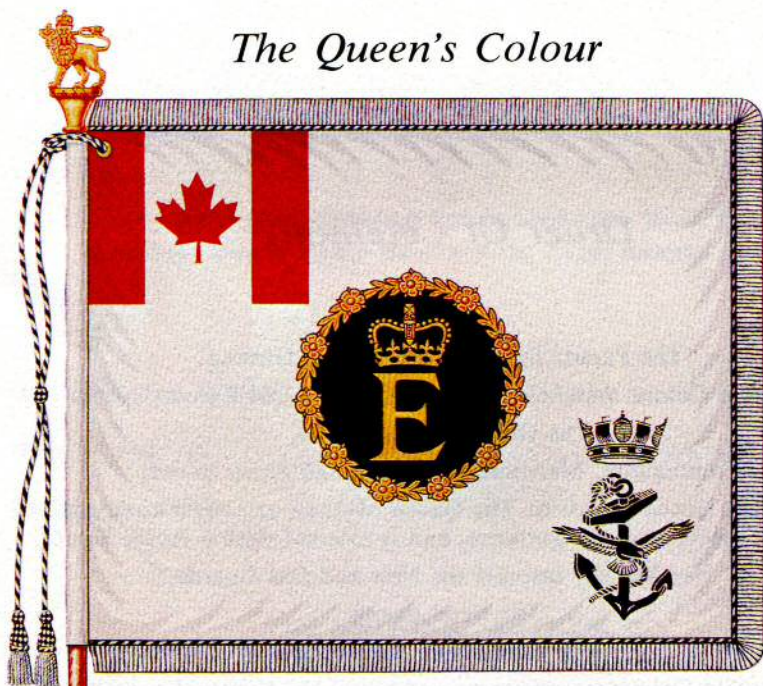
The New Colour